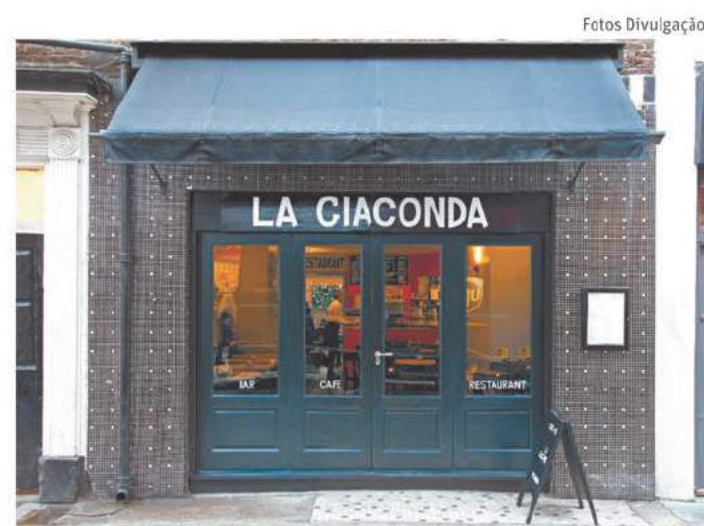
La Giaconda hoje é mais sofisticado que quando Bowie ia