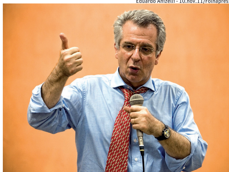
Eduardo Anizelli - 10.nov.11/Folhapress