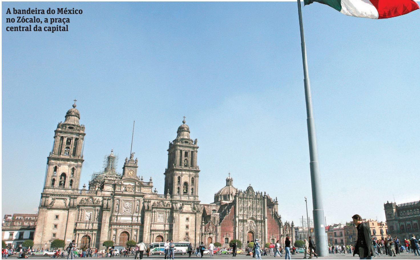
A bandeira do México no Zócalo, a praça central da capital