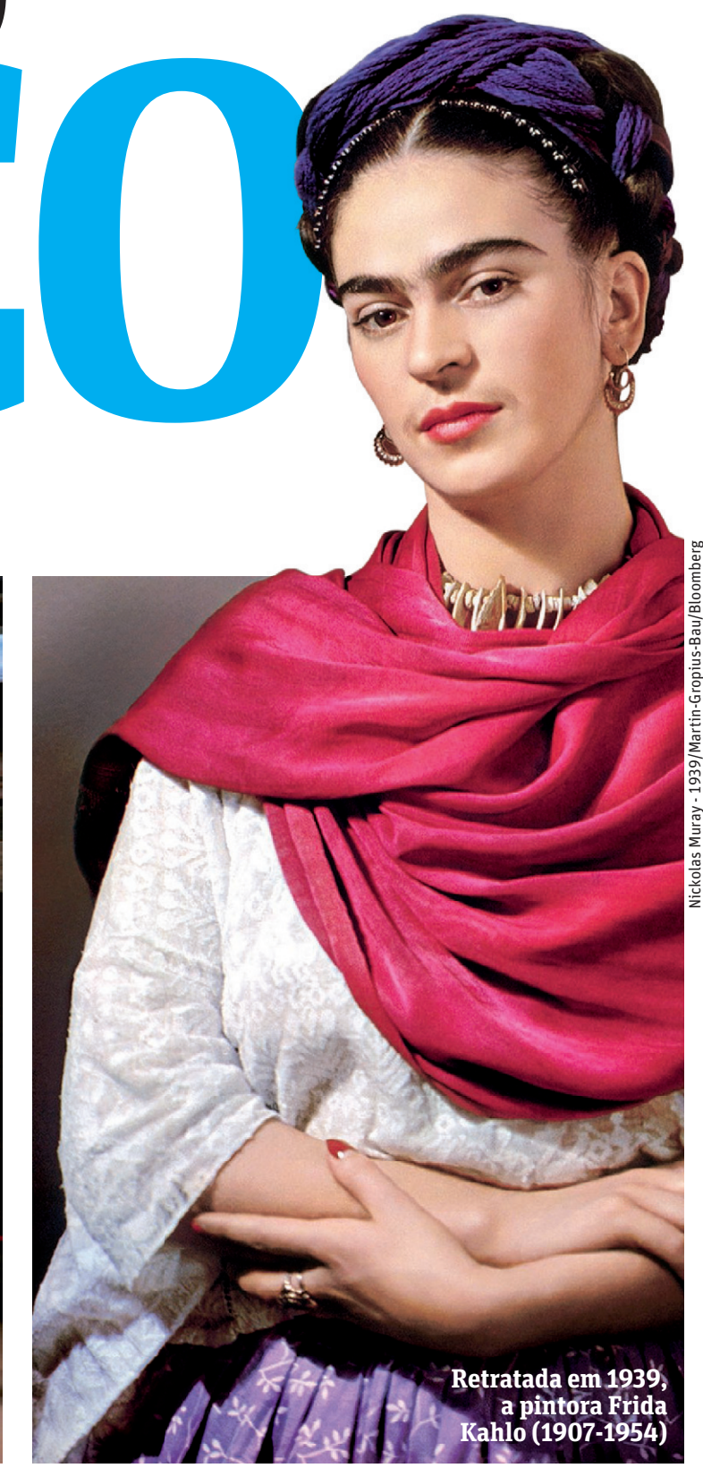
Retratada em 1939, a pintora Frida Kahlo (1907-1954)