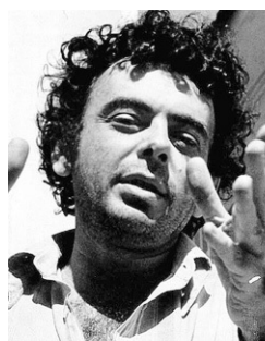
Glauber Rocha (1939-1981) Cineasta, dirigiu "Terra em Transe" e "Deus e o Diabo na Terra do Sol"