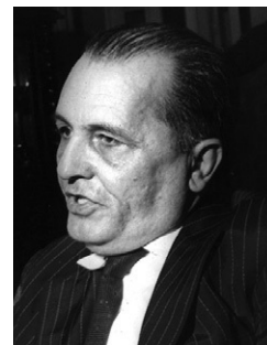
Luiz Carlos Prestes (1898-1990) Líder comunista, foi senador da República (PCB)

Fonte: Banco de Dados/Folhapress; biblioteca Mario de Andrade; arquivo de notícias da Associação dos Amigos do Museu de Arte Moderna (SP)