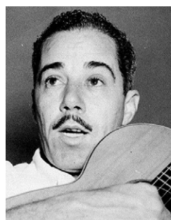
Sílvio Caldas (1908-1998) Cantor que doou um violão para o bar do Museu, exposto até hoje