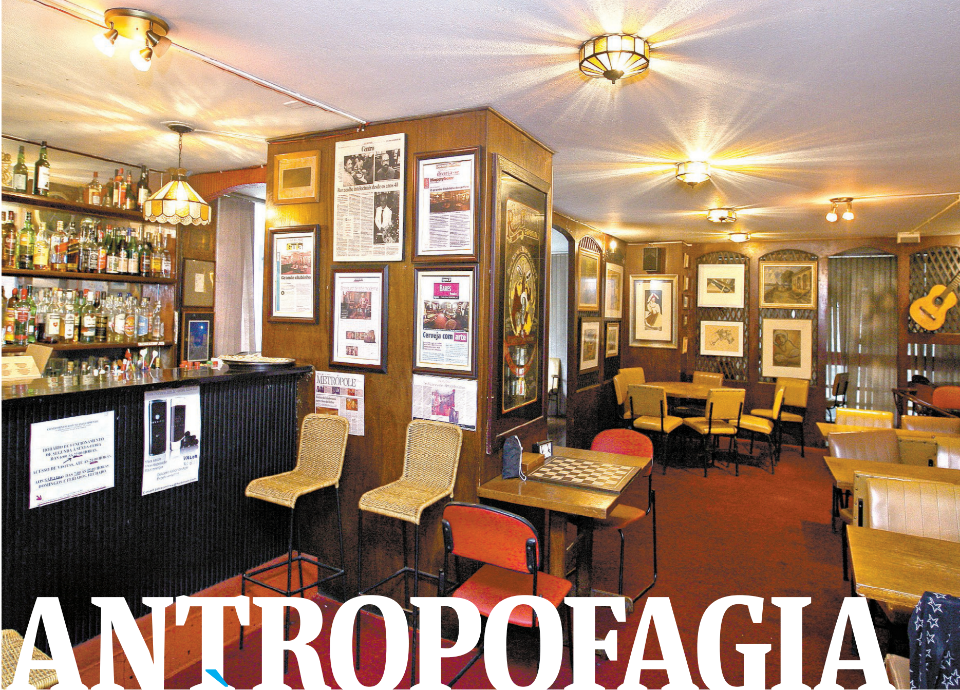
Aspecto atual do interior do bar dos amigos do Museu de Arte Moderna de SP