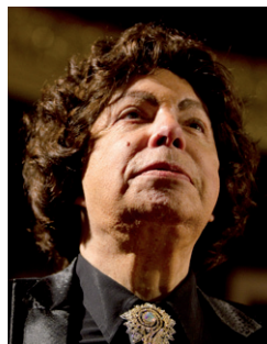
Cauby Peixoto, 80 Cantor