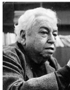
Di Cavalcanti (1897-1976) Pintor, doou obra para o bar, que, contudo, não está mais no acervo