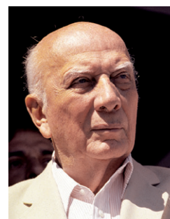
Ulysses Guimarães (1916-1992) Deputado federal por diversas legislaturas (MDB/PMDB)