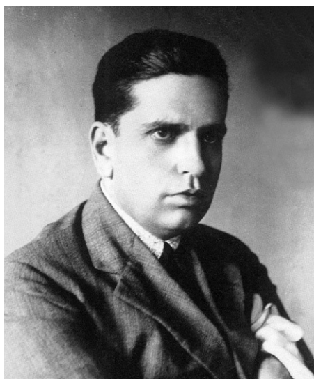
Oswald de Andrade (1890-1954) Escritor e poeta, autor do "Manifesto Antropofágico"