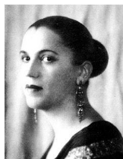
Tarsila do Amaral (1886-1973) Pintora que estava na fundação do bar do Museu, autora do óleo "Abaporu"